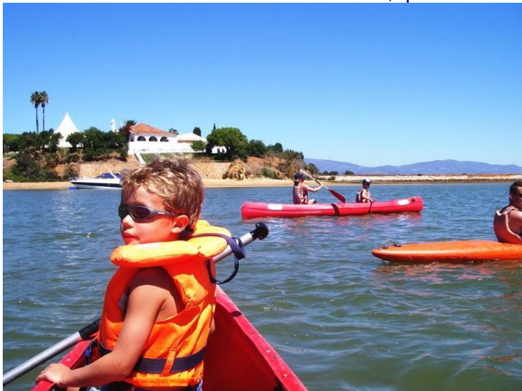
Program Outdoor Tours.com Lda. 2009 - KANUFAHREN.doc

Sítio das Boiças, CCI 900, EN 125, 8500-132 Mexilhoeira Grande Tel. (+351) 282 969 520 Mob. (+351) 916 736 226